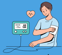
ہائی بلڈ پریشر

بیماری کی وجہ بننے والے خطرے کے عوامل اکثر ایک ساتھ ہوتے ہیں۔ مثلاً، جن لوگوں کو ذیابیطس ہوتی ہے، ان میں ہائی بلڈ پریشر اور کولیسٹرول زیادہ ہونے کے امکانات بھی زیادہ ہوتے ہیں۔